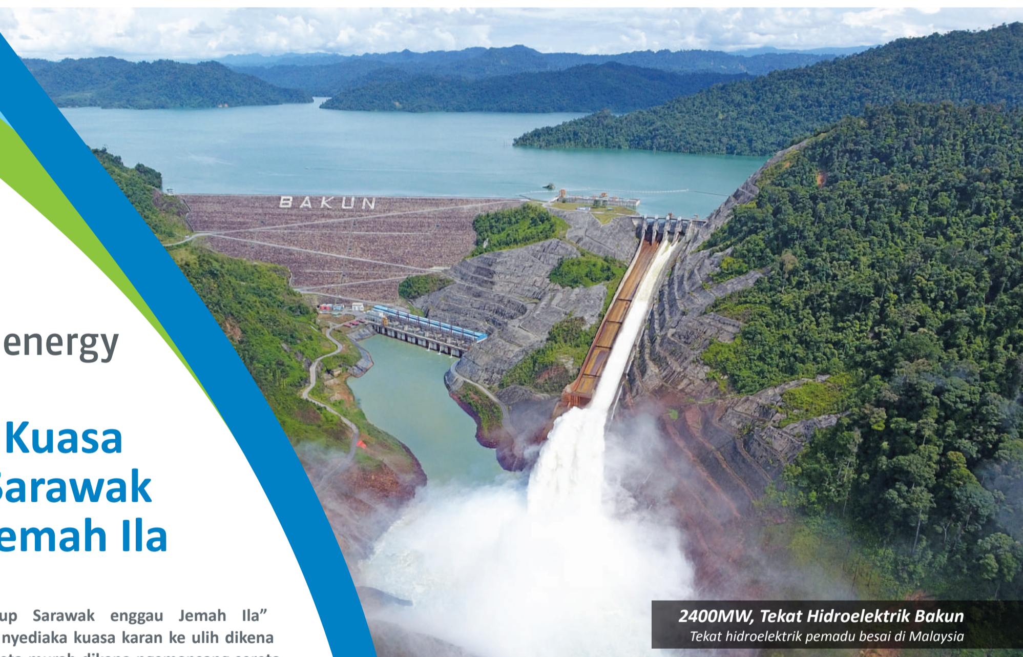
2400MW, Tekat Hidroelektrik Bakun Tekat hidroelektrik pepadu besai di Malaysia