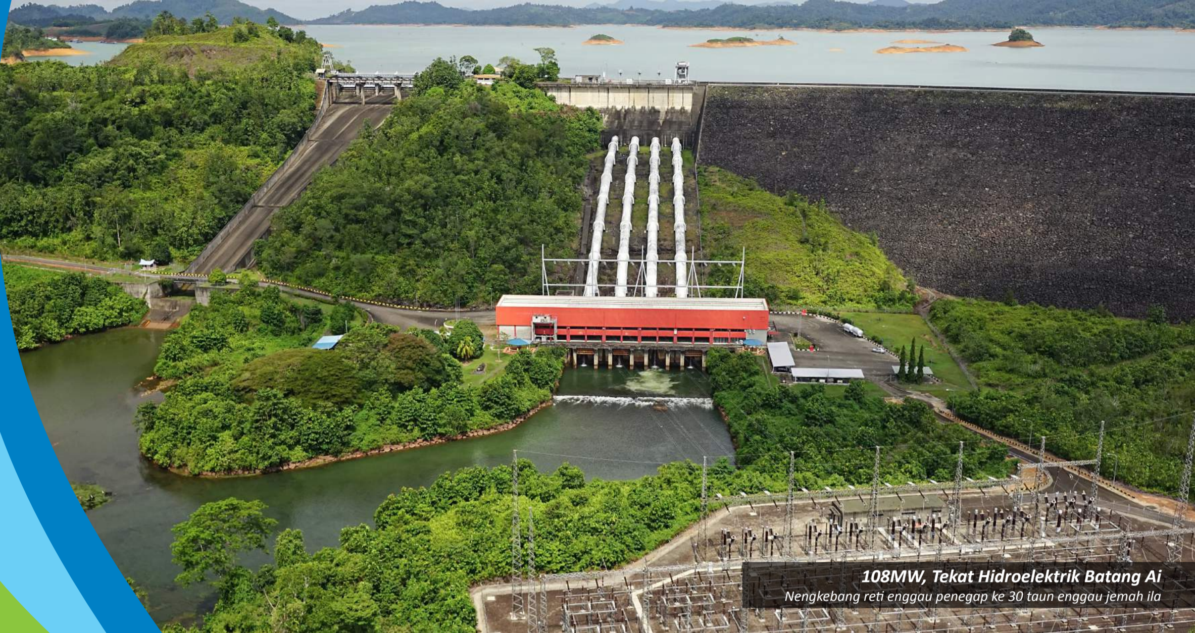
108MW, Tekat Hidroelektrik Batang Ai Nengkebang reti enggau penegap ke 30 taun enggau jemah ila